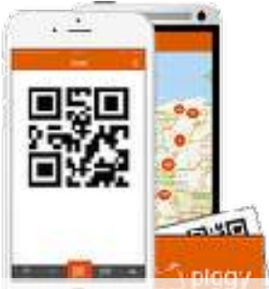
Fig. 3, Piggy app https://www.piggy.nl/app