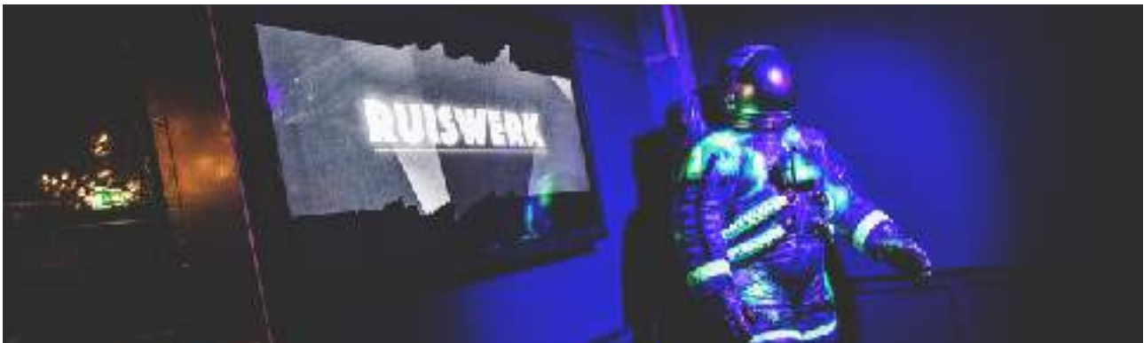
Fig. 1, Ingang Club Ruis http://clubruis.nl

Bezoekers van Ruis kunnen rekenen op een kleurrijke mix van vernieuwende elektronische muziek, een vrije sfeer en attente bediening. Ruis biedt ruimte aan 400 mensen. (Club Ruis, z.j.)