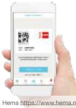
Fig. 5, Hema https://www.hema.nl/meerhema